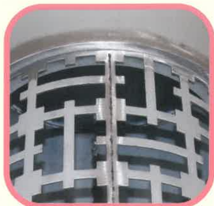
板のつなぎ目にスムーズ!