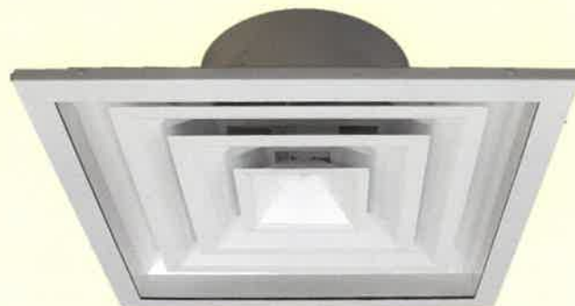
新型 E 2 ( K B )

角型シーリングディフューザ ( E 2 、 通称=角アネモ ) が4月に新型になります。