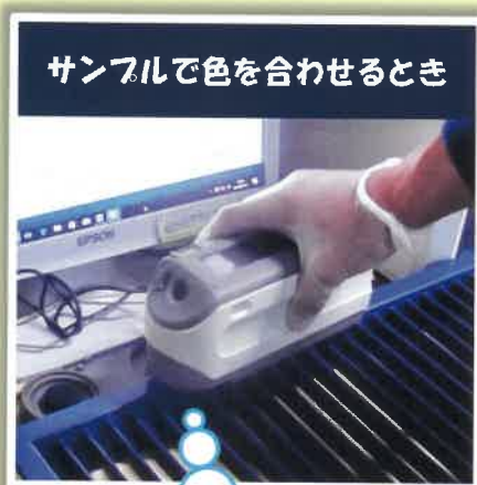
サンプルで色を合わせるとき