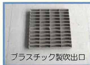
プラスチック製吹出口